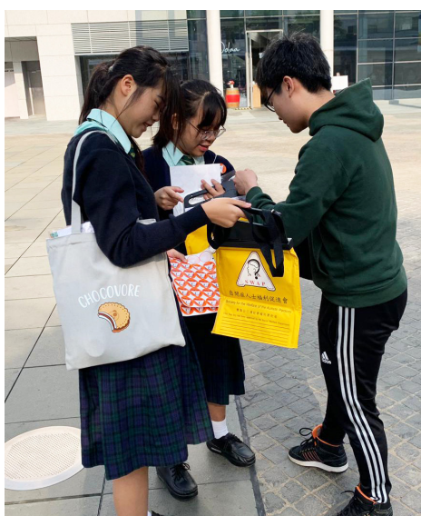
自閉症人士福利促進會賣旗日