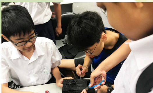
同學製作人工智能機械人