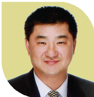
黃楚標先生 香港城市大學榮譽院士, JP