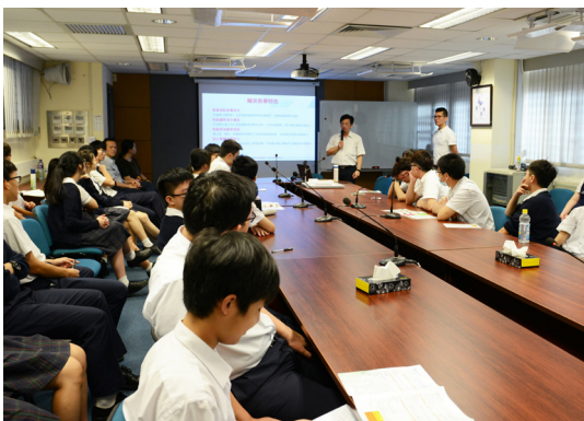
台灣輔英科技大學升中講座

我們明白學生在不同的階段，有著不同的需要。我們嘗試了解學生所需，為他們提供支援，讓他們在成長路上，可以走得更穩更遠，也希望他們感受到我們的關愛，並把這愛的火種延續下來，傳揚出去。