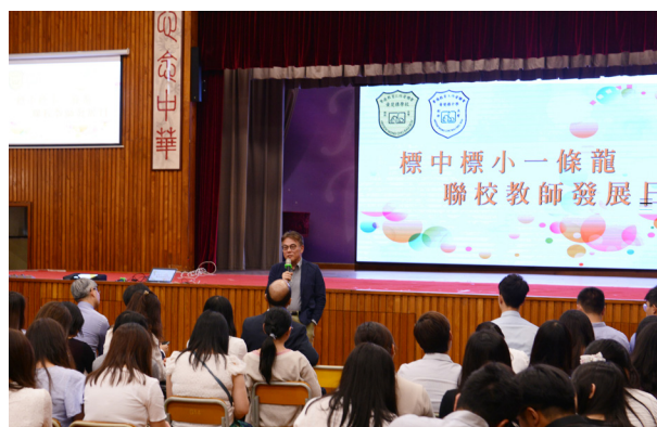
中小學一條龍聯校專業發展日