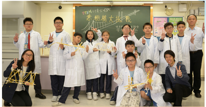
STEM 小博士創科體驗日

我們不僅在校內推動 STEM，更把經驗推而廣之，為區內學生建構接觸 STEM 的平台。2019 年 11 月 12 日，我們一連幾個周末舉辦「STEM 小博士創科體驗日」，以不同的主題，讓區內小學生認識 STEM，領略學習數理科技的樂趣，並從中認識基礎科學知識。12 月 14 日，我們舉行了「STEM 小博士創科體驗日頒獎禮」，表揚在學習過程中表現優秀的學生，希望在他们心中埋下科技創新的種子。