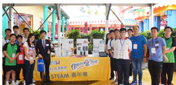
海洋公園 STEAM 嘉年華