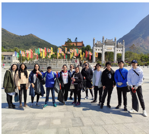
扶輪社昂坪清潔日

潔昂坪日」，整項活動由學生親自策劃，寓學習於服務。活動中，學生不僅進行了社會服務，更親身體驗到如何規劃活動，有助提升學生的組織能力。2020年5月23日，中學復課在即，我們為校舍噴灑消毒鍍膜。學生得悉此事，主動回校充當義工，為校舍消毒。學生在過程中表現積極，充分展現出「為人民服務」的精神。在疫情停課期間，學生仍然願意回校擔任義工，實在難能可貴，也展示了我們一直熱心培養學生樂於服務的成果。