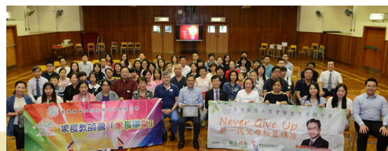
家教會會員大會暨