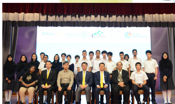
扶輪社青年團標 Interact Club 成立儀式