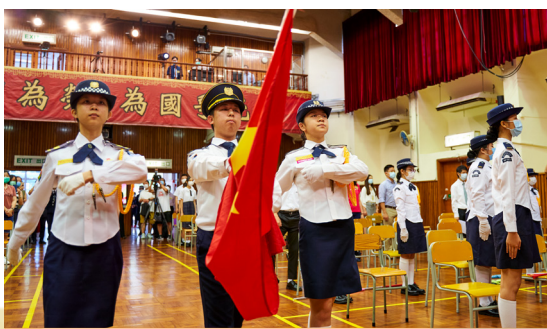
慶祝香港回歸祖國二十三周年升旗禮