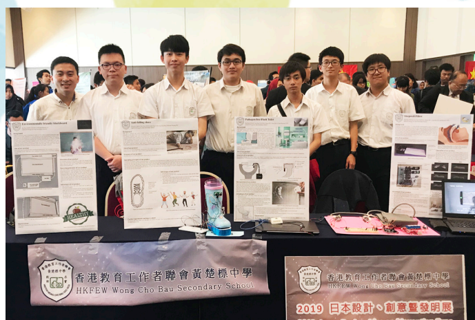
日本設計、創意暨發明展