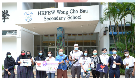
全校噴灑消毒鍍膜