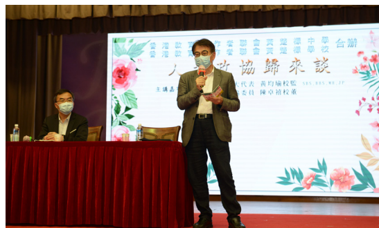
「人大政協歸來談」教師講座