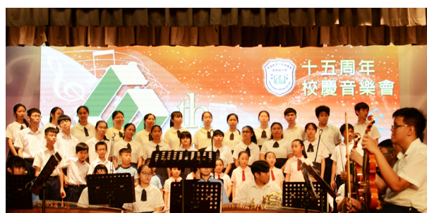
十五周年校慶音樂會