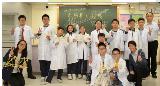
STEM 小博士創科體驗日