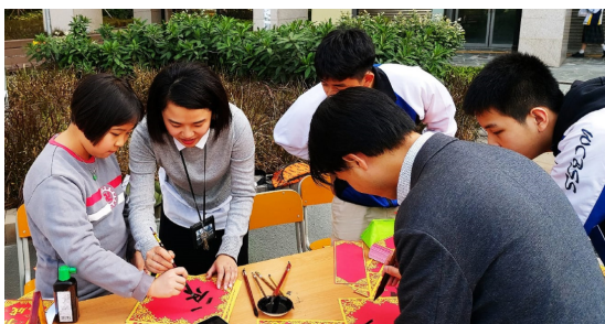
社區新年賀歲寫揮春活動