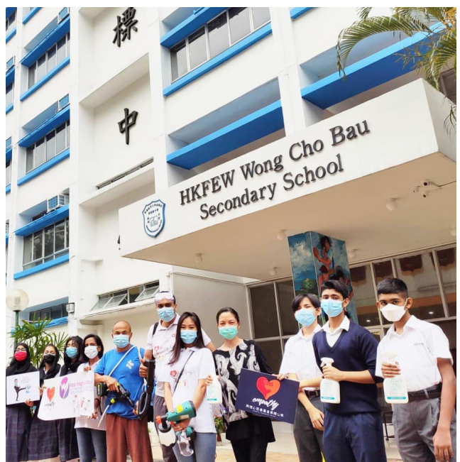
同學們擔任義工助手，體驗噴灑消毒鍍膜的過程，認識其中原理，寓學習於服務。

除了在校內設立領袖生、英語大使等服務崗位，本年度，我們參與了課託活動。老師帶領學生義工，定期到小學輔導小學生。義工在過程中，不僅教學相長，學習到基本授課技巧，更體驗到幫助別人的成功感，建立自信。這對推動學生日後繼續服務，有著積極的作用。另外，我們近年與扶輪社合作，成立了 Interact Club，推動學生自己規劃、組織社會服務活動。本年度，我們在 2019 年 12 月，進行了「清