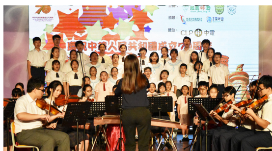
情牽家國赤子情晚會