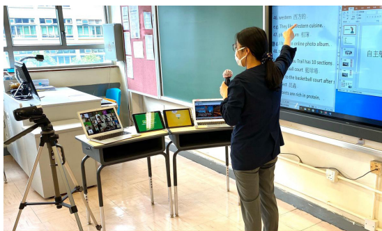
推行 zoom 實時網上授課