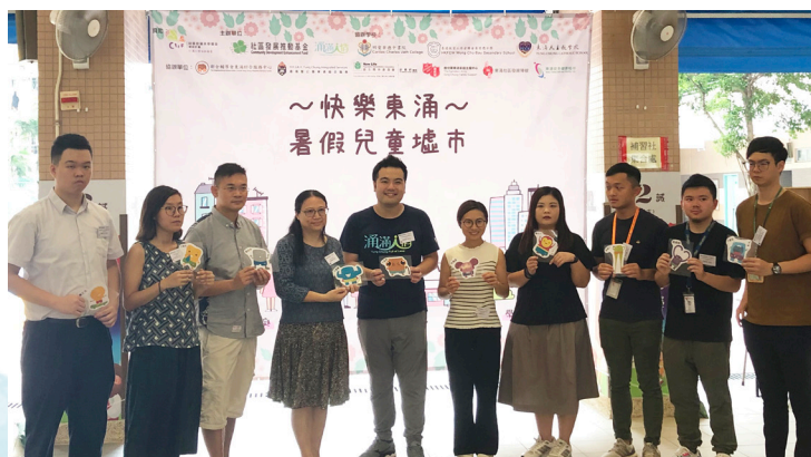
社區發展推動基金有限公司「快樂東涌 ~ 暑假兒童墟市」