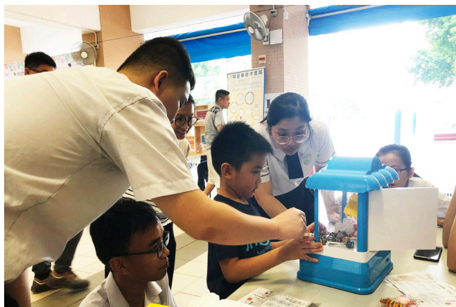
義工隊「快樂東涌～暑假兒童墟市」